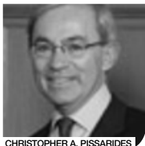
CHRISTOPHER A. PISSARIDES