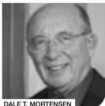
DALE T. MORTENSEN

Le 11 octobre 2010, le Prix de la Banque de Suède en sciences économiques en mémoire d'Alfred Nobel a été attribué à deux Américains, Peter A. Diamond , 70 ans, économiste à l' Institut de technologie du Massachusetts (MIT) , Dale T. Mortensen , 71 ans, professeur d'économie à l' Université Northwestern à Evanston dans l'Illinois, ainsi qu'à un Britannique d'origine chypriote, Christopher A. Pissarides , 62 ans, professeur à la